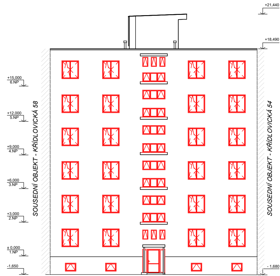
POHLED Z UL. KŘÍDLOVICKÁ